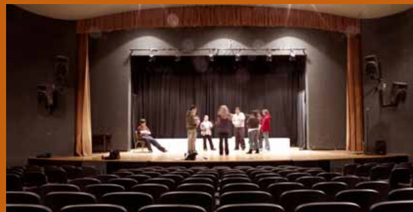
DES ACTIVITÉS CULTURELLES ET ARTISTIQUES