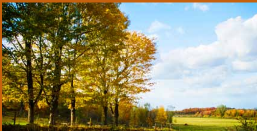
DES PAYSAGES À COUPER LE SOUFFLE